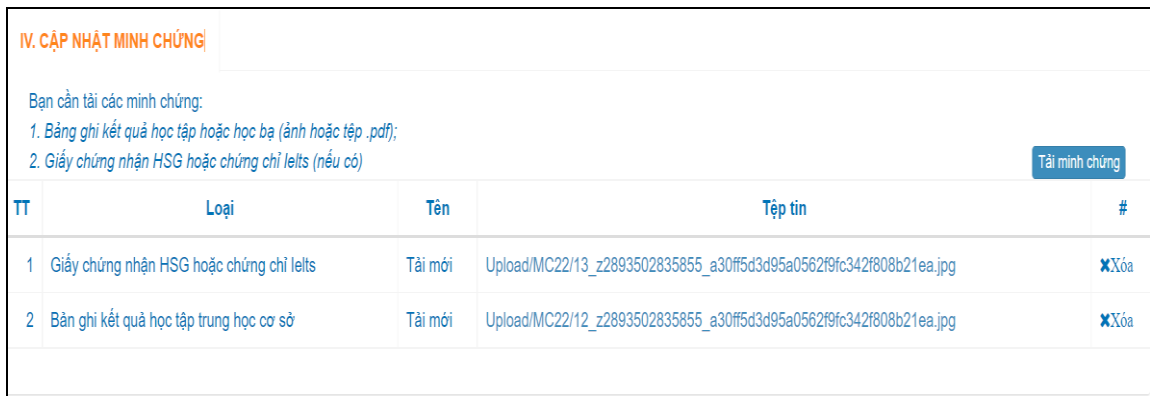
Hình 6: Giao diện minh chứng đã được cập nhật

Lưu ý: Các loại minh chứng là bắt buộc, minh chứng tải lên khi đã hoàn thành hồ sơ thì không xóa được, chỉ được bổ sung thêm.