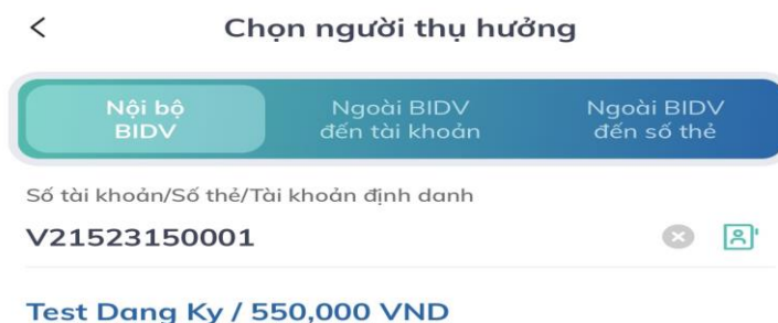
Hình 7: Giao diện nhập tài khoản và kiểm tra