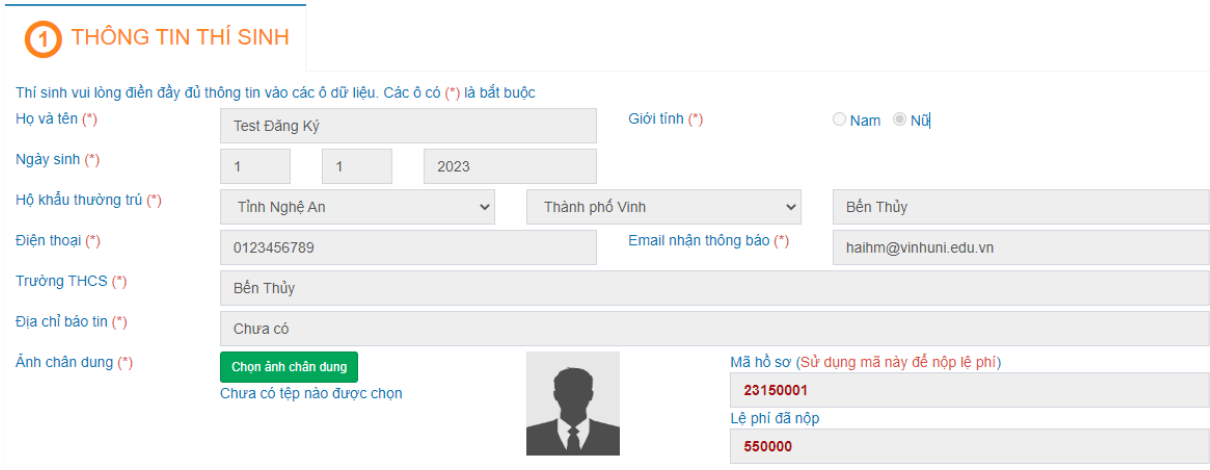
Hình 1: Giao diện cập nhật thông tin cá nhân